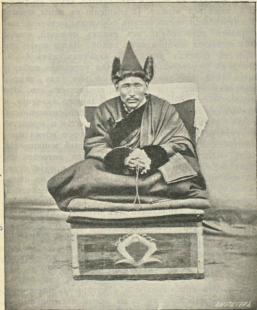
Рис. 3. Настоятель (ширегуй) бурятского монастыря.