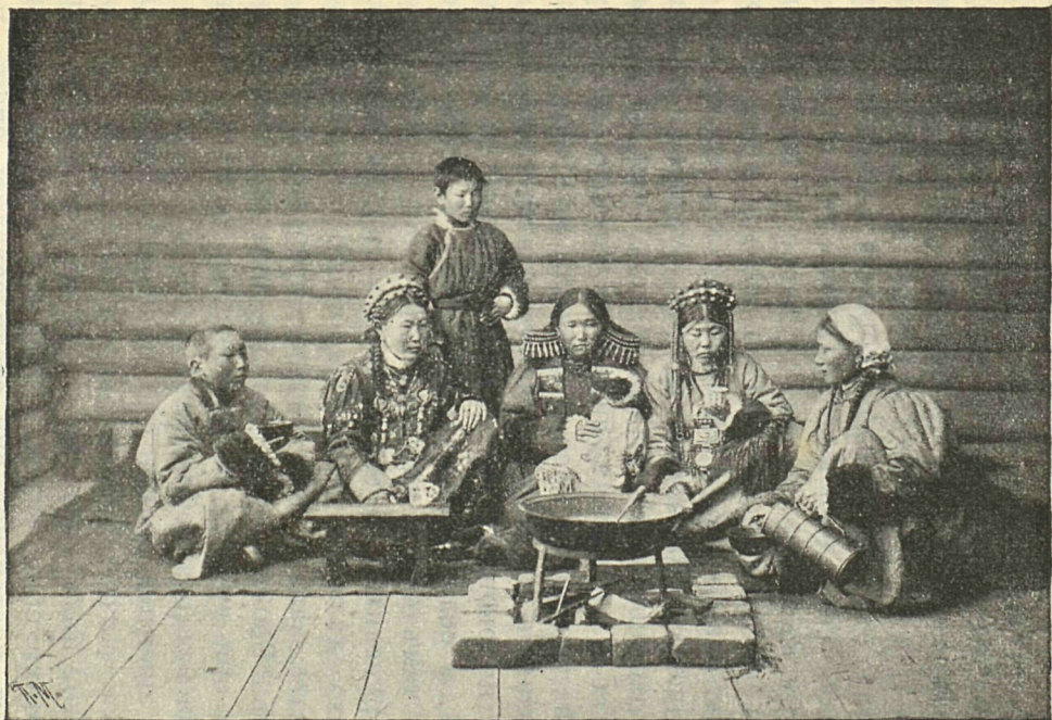
Рис. 5. Буряты за чаемъ.