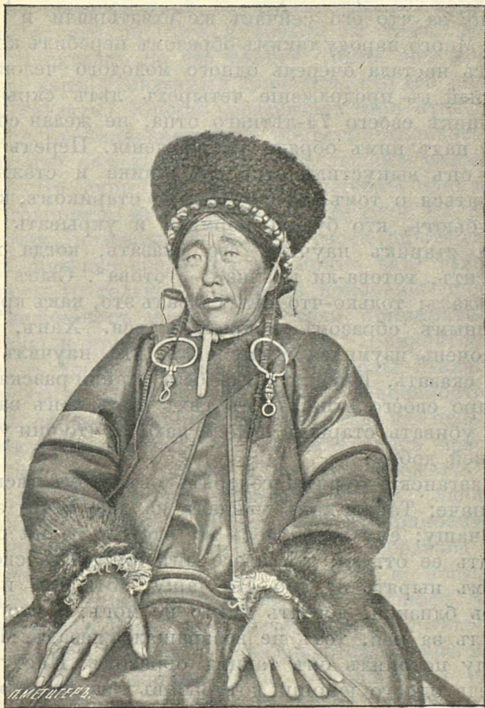
Рис. 2. Бурятка.