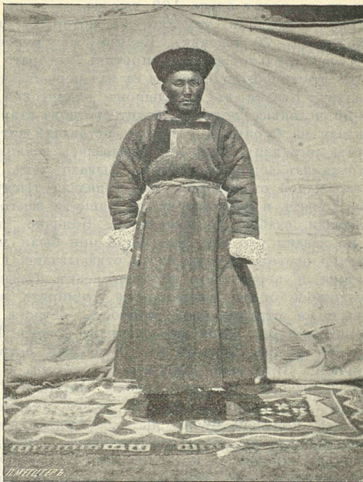
Рис. 1. Буряты.