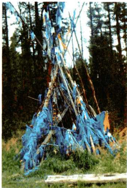
Обо у подножья Бурхан-Халдун.