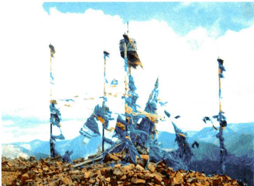
Обо Чингисхана на вершине Бурхан-Халдун.