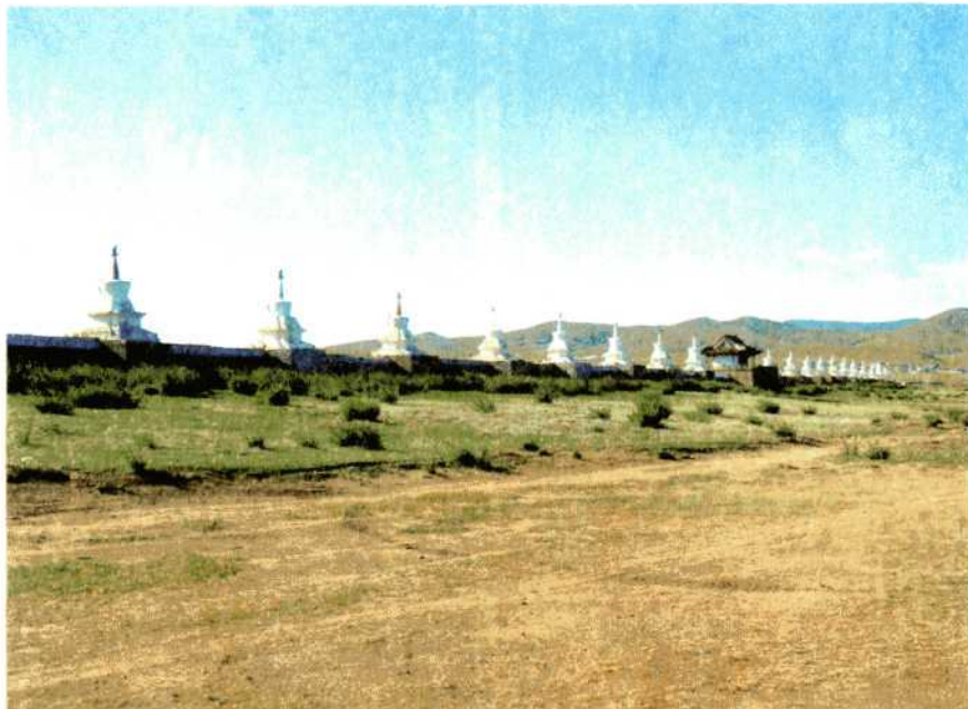
Общий вид монастыря Эрдени-цзу.