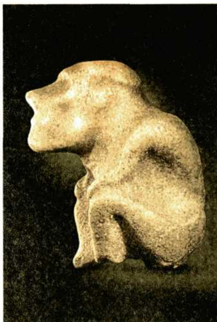
Древнее изображение сидящего мужчины.