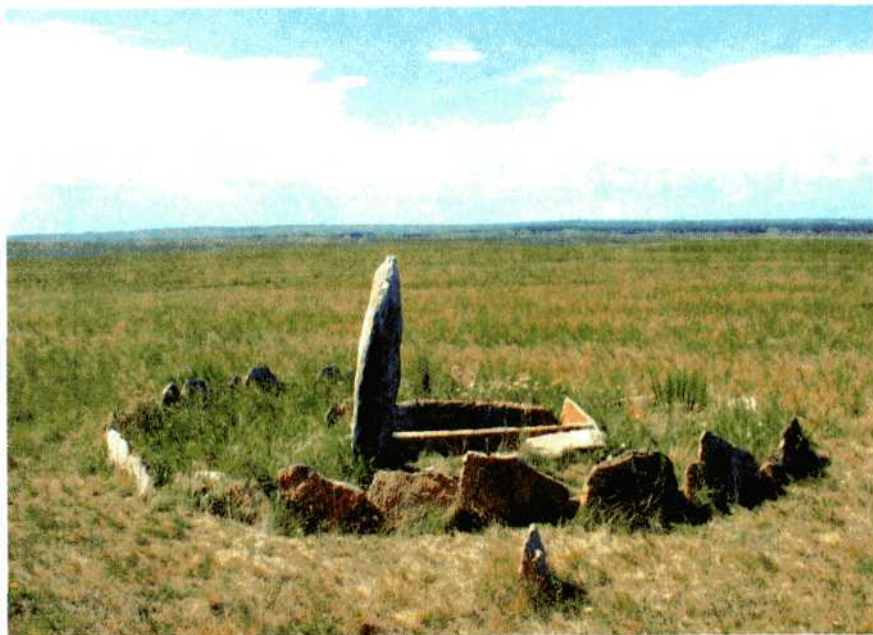
Погребальная ограда с менгиром. Аркаим.