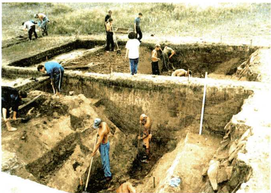
Раскопки фортификационных сооружений. Поселение Аландское. XVIII-XVII вв. до н.э.