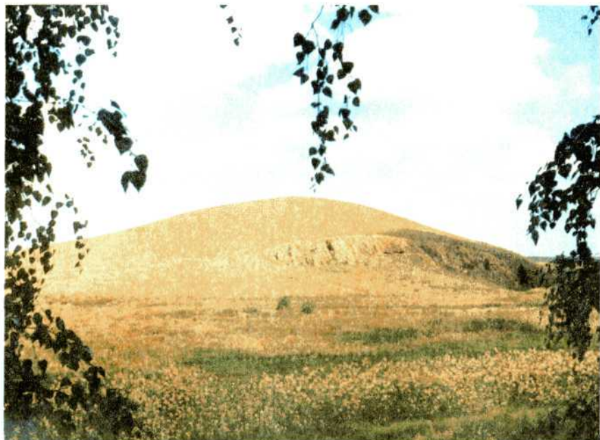
Палеовулкан Огненный. Аркаим.