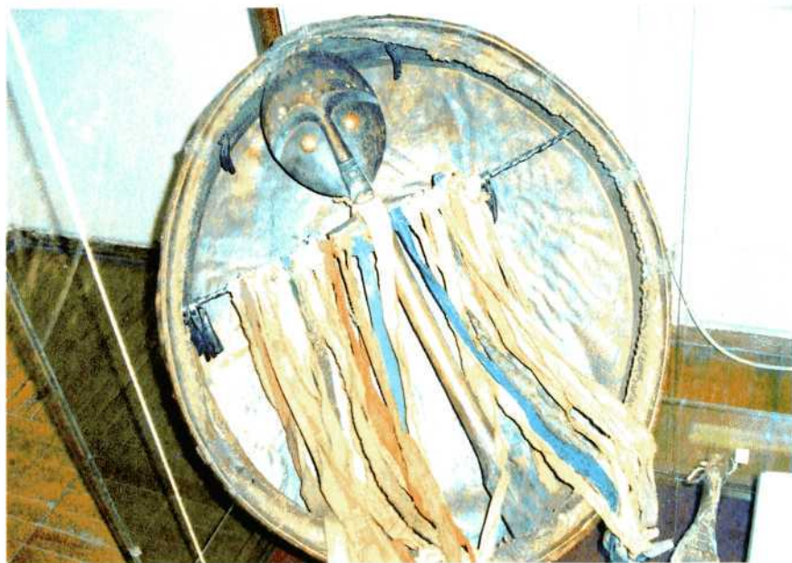
Шаманский бубен в музее Горно-Алтайска.