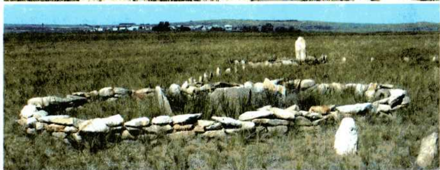
Реконструкции погребальных сооружений различных эпох. Аркаим.