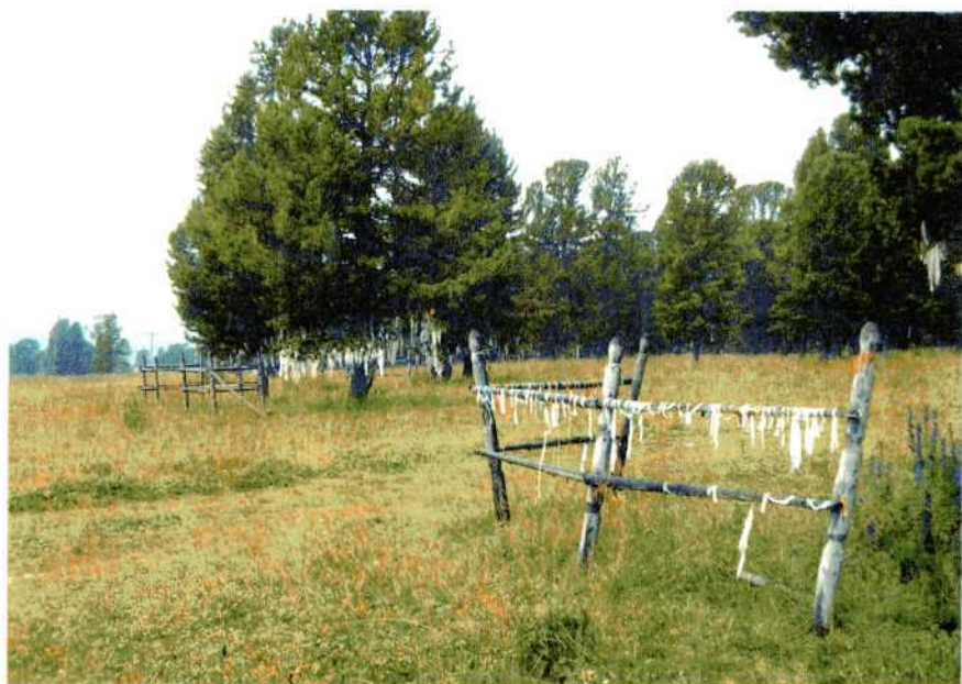
Кыйра на кедрах. Алтай.