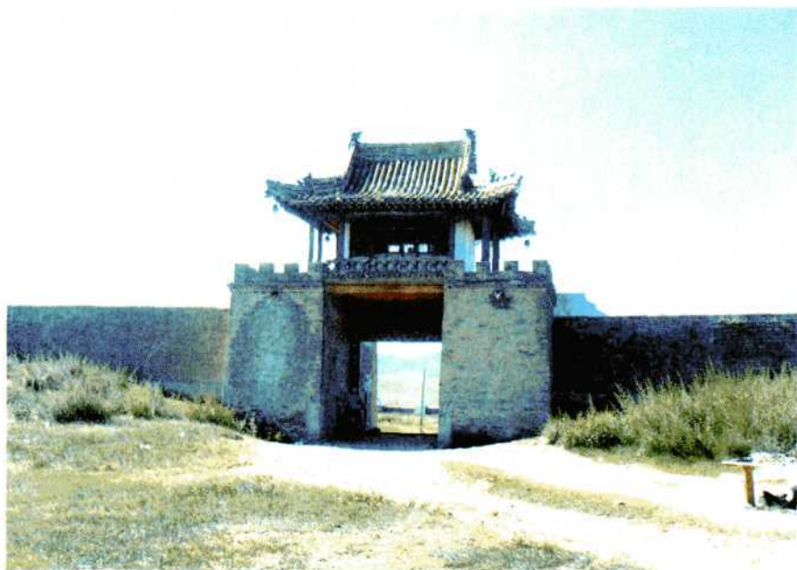
Ворота в монастырь Эрдени-цзу. Монголия.