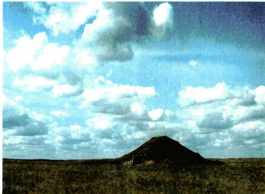
Курган Темир. V-IV вв. до н.э. Реконструкция. Аркаим.