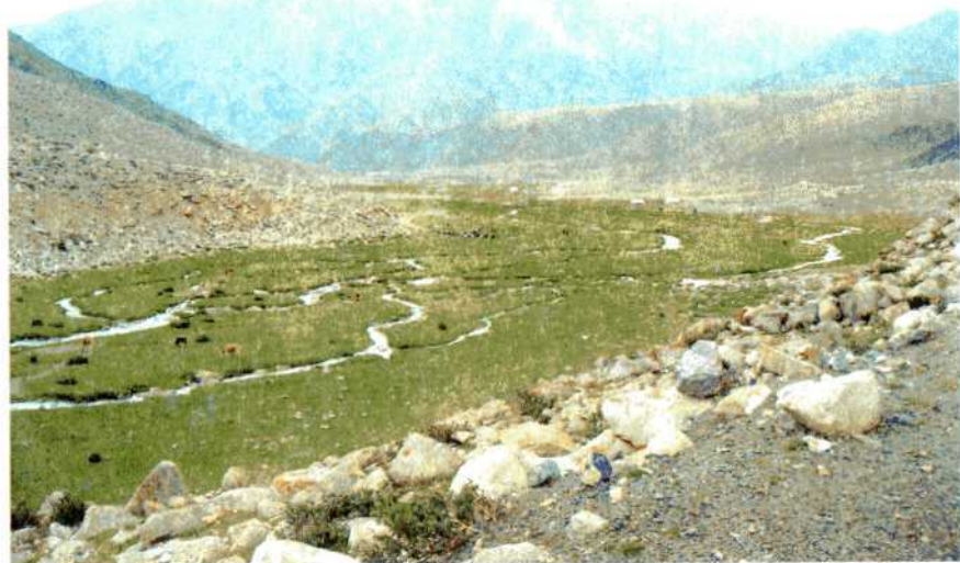
Долина Монгольского Алтая.