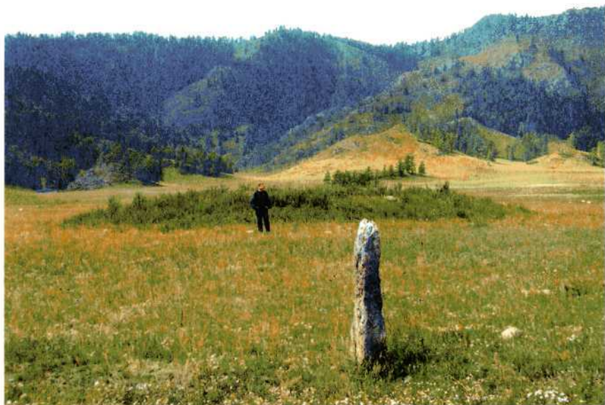
Курганы Куладинского могильника. Алтай.