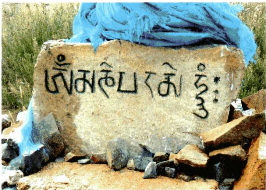
Тибетская надпись на обо. Монголия.