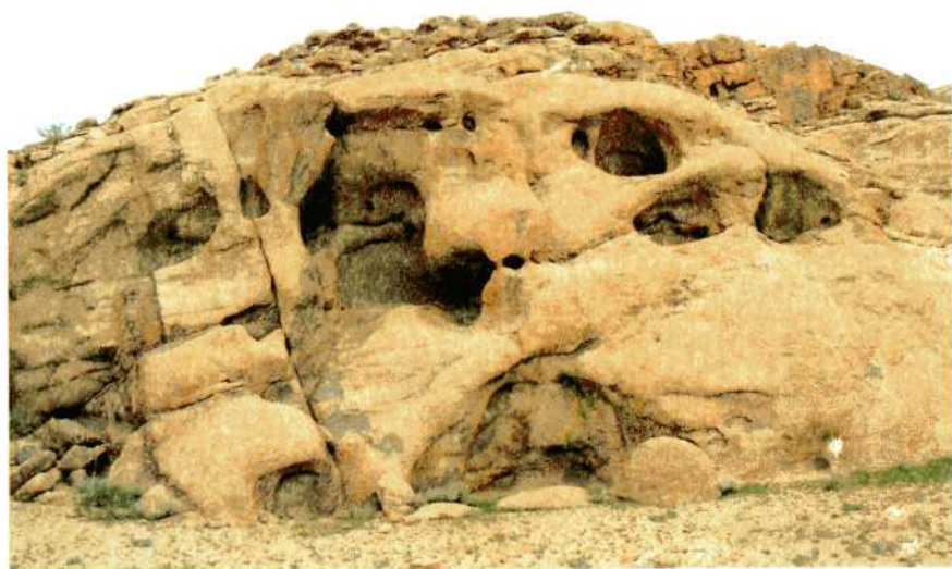
Скалы Монгольского Алтая.