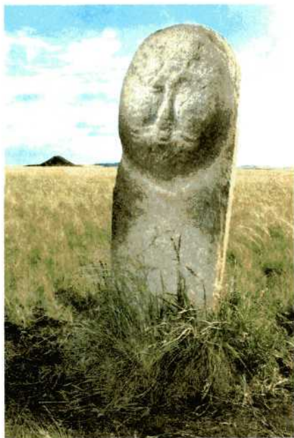
Тюркское изваяние эпохи раннего средневековья.