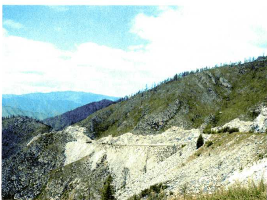
Перевал Чике-Таман. Алтай.