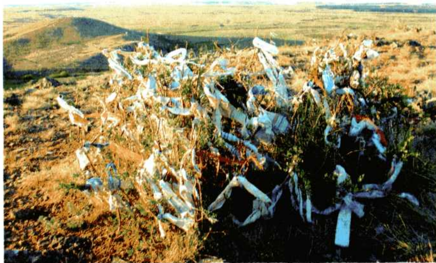
Возрождение древних обрядов на Аркаиме.