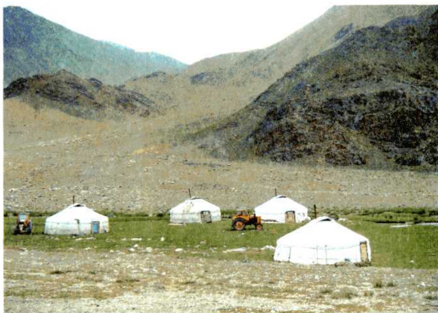
Кочевье в Монгольском Алтае.