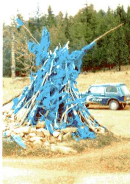
Обо на перевале.