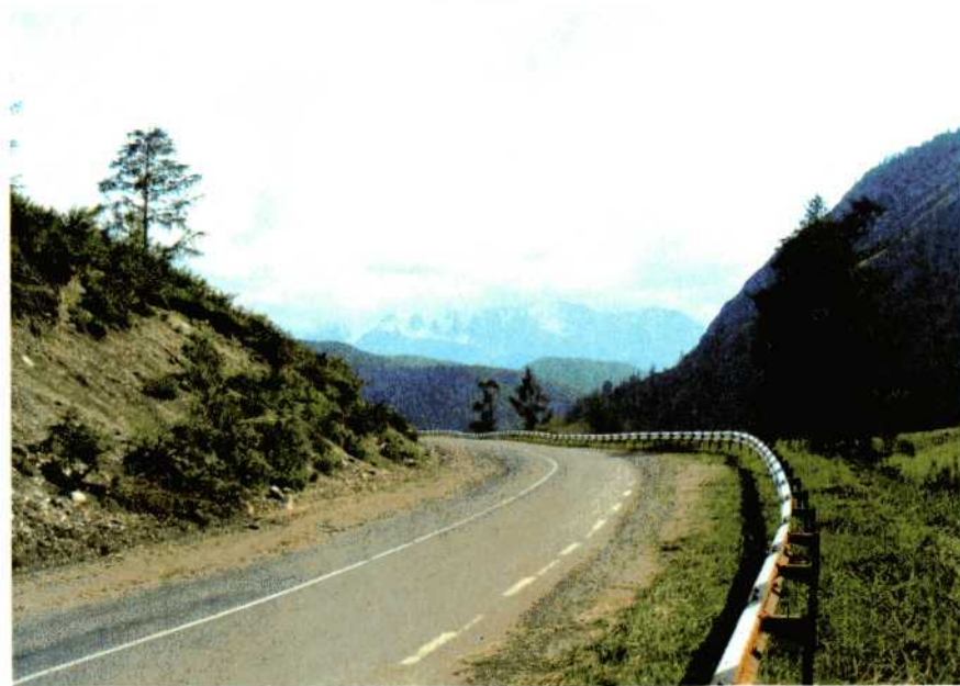
Южно-Чуйский хребет. Алтай.