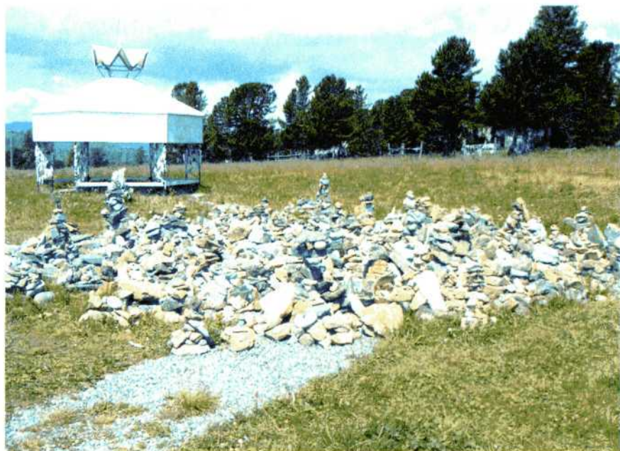
Культовый комплекс на Семинском перевале.