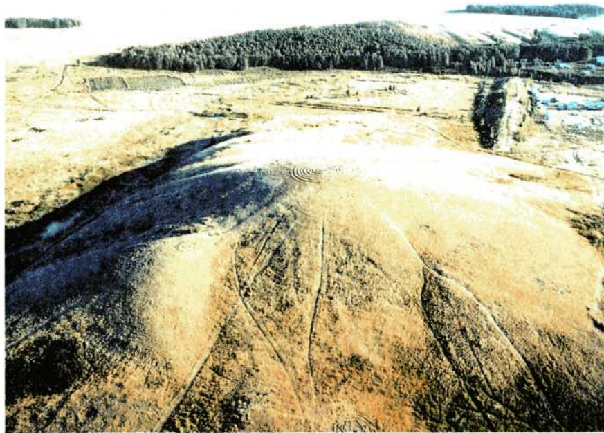
Вершина палеовулкана Огненный. Гора Шаманка. Аркаим.