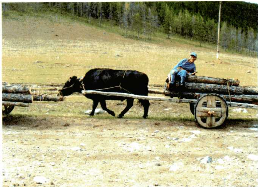
Традиционные колеса. Монголия.