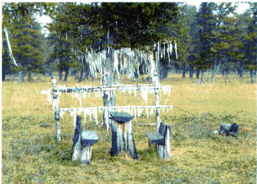
Кыйра на Семинском перевале. Алтай.