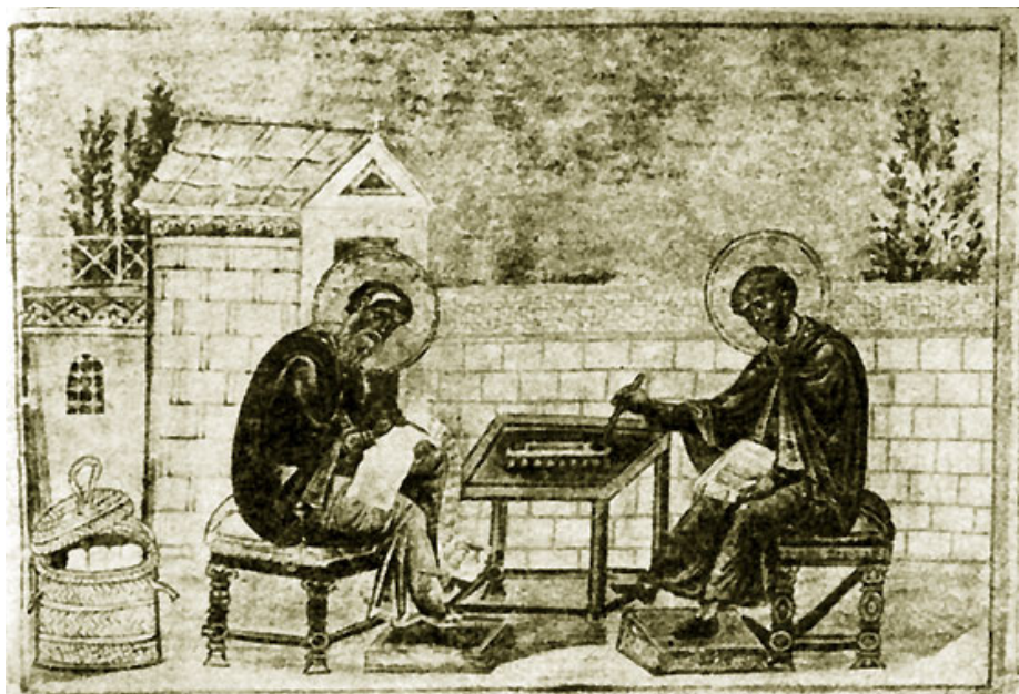
Писцы за работой. Иллюстрация из 'Минология Василия II'. Начало XI в. Ватикан.

На положении ученых людей в обществе и на судьбах образования обычно серьезно отражалось отношение к грамотности и образованности правящего василевса. Одним это отношение было при Ираклии, который нередко использовал книги как орудие для избиения провинившегося сановника, другим - при Льве VI и Константине VII, которые не только читали книги, но с охотой сочиняли их сами. Вскоре после Константина VII наступил, видимо, упадок образованности в империи. Василий II не уважал ученость, но (удивительное дело! - восклицал Пселл) множество людей подвизалось на ученом поприще, хотя о деятельности прославленной Магнаврской школы, основанной еще в середине IX в., в источниках того времени нет никаких упоминаний. При Константине IX, по