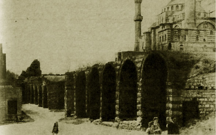
Развалины Большого императорского дворца. Стамбул. Фото 1961 г.

Следствие над государственными преступниками велось, когда они находились уже в тюрьме. Пытка в таких случаях была обычной при допросах: знатного освобождали от нее, если он совершал лишь уголовное преступление. Константин Диоген, повинный в заговоре (этот видный полководец был отцом Романа IV), не вынес пыток, которыми руководил Орфанотроф, и разбился насмерть, бросившись во время прогулки со стены Влахернской тюрьмы. Василий Петин при Романе II и Лев Ламброс при Константине IX сошли с ума от пыток, а Роман Стравороман скончался - под пытками.