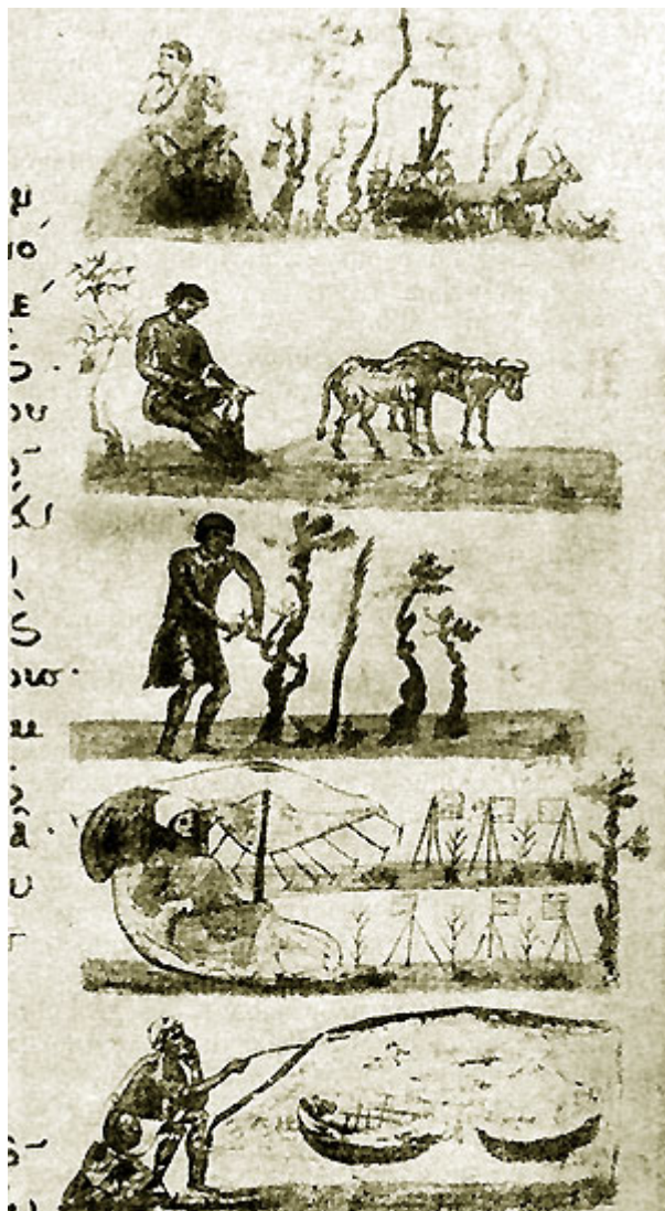
Сцены из сельской жизни. Иллюстрации к 'Словам' Григория Назианзина. XI в. Париж. Национальная библиотека.