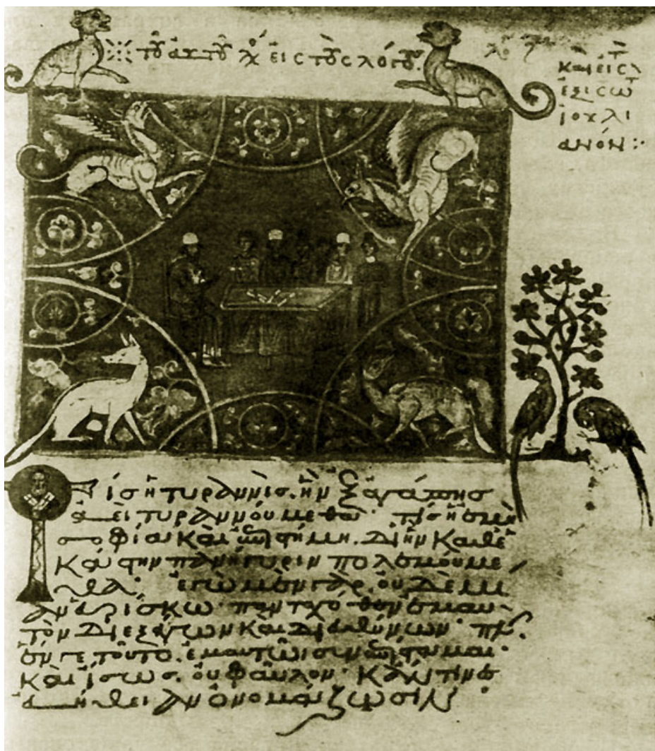
Собор податей. Иллюстрации к 'Словам' Григория Назианзина. XI в. Париж. Национальная библиотека.

С общением стратиотов казна все чаще оказывалась вынужденной выплачивать им ситиресий (или опсоний -