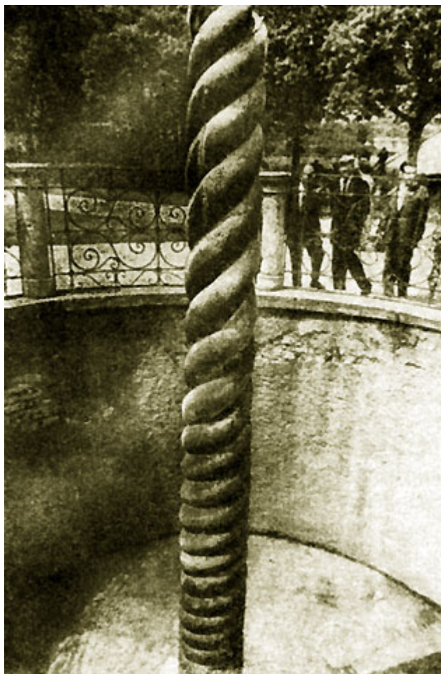
Дельфийская колонна(V в. до н. э.), установленная на ипподроме в X в. Стамбул. Фото 1961 г.

расходившиеся отсюда группами по домам знати для увеселения ее на ночных пирушках.