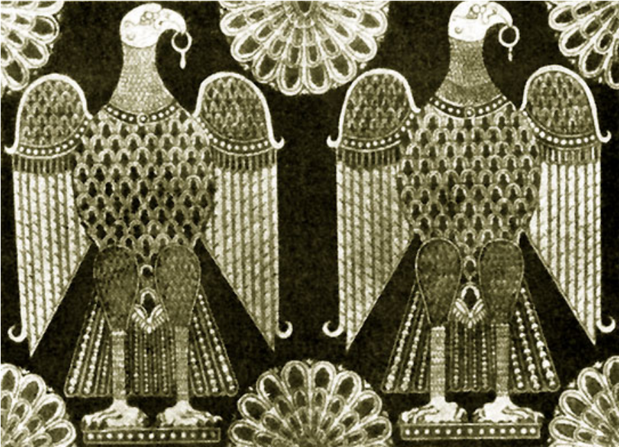
Ткань с изображением орлов. X в. Сен-Жермен. Оксер (близ Парижа)

полуголодное существование уходило в день до восьми-десяти фоллов. А если мистий питался у хозяина, то для семьи он получал на день не более трех фоллов. Власти запрещали мастерам сманивать мистиев друг у друга, платить им вперед более чем за 30 дней, а иногда и нанимать мистия вообще: более чем на три месяца. Даже каменотес за свой каторжный труд получал около 20 фоллов в день, тогда как удачливый нищий собирал до 100.