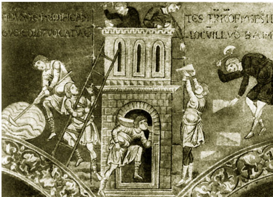
Строительные работы. Мозаика. Конец XII в. Монреаль (Италия)