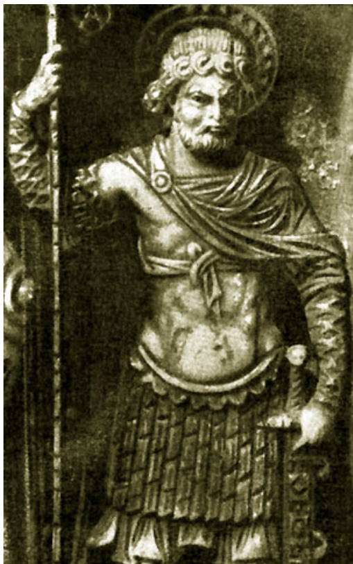
Воин. X-XI вв. Слоновая кость. Ленинград. Государственный эрмитаж.

Серьезное значение для исхода мятежа имела позиция церкви: и митрополитов в провинциях, и иерархов в столице. Сами патриархи иногда были не только участниками, но и инициаторами заговоров. Лев VI принудил патриарха Николая отречься от сана, дав ему понять, что располагает документами об участии владыки в заговоре Андроника Дуки.