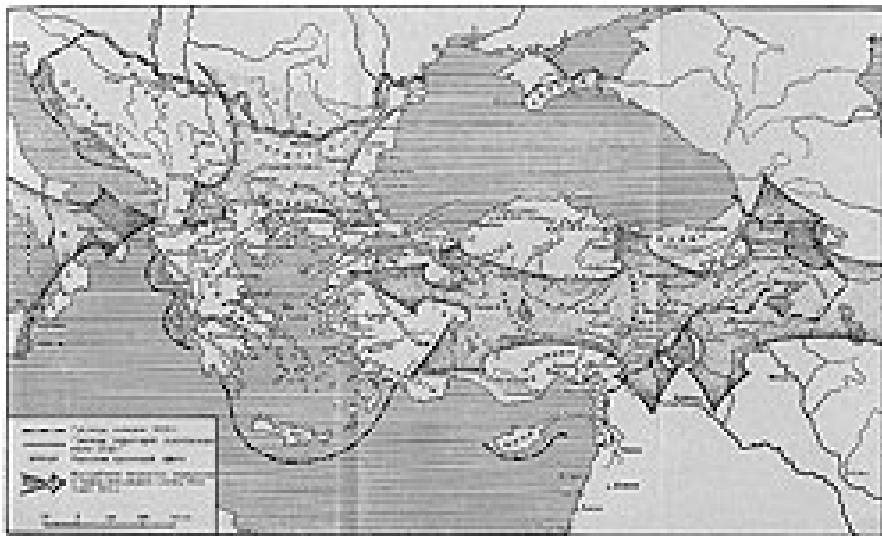
Византийская империя. IX-XII вв.

для их реализации. Никита Хониат пишет, что ромеи роптали, недовольные экспедициями этого императора в Италию, приведшими к растрате огромных средств. Что касается прочих войн империи, то подавляющее их большинство велось в IX-XII вв. с целью возвращения ближайших и недавно потерянных областей или имело исключительно оборонительный характер.