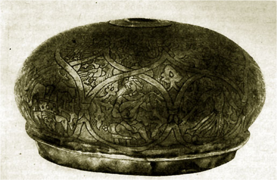
Крышка серебряного сосуда. Музыканты, плясуны, акробаты. XII в. Ленинград. Государственный эрмитаж.

обвиняли в том, что они втайне развлекались представлениями мимов, скрытно проведенных в патриаршие палаты.