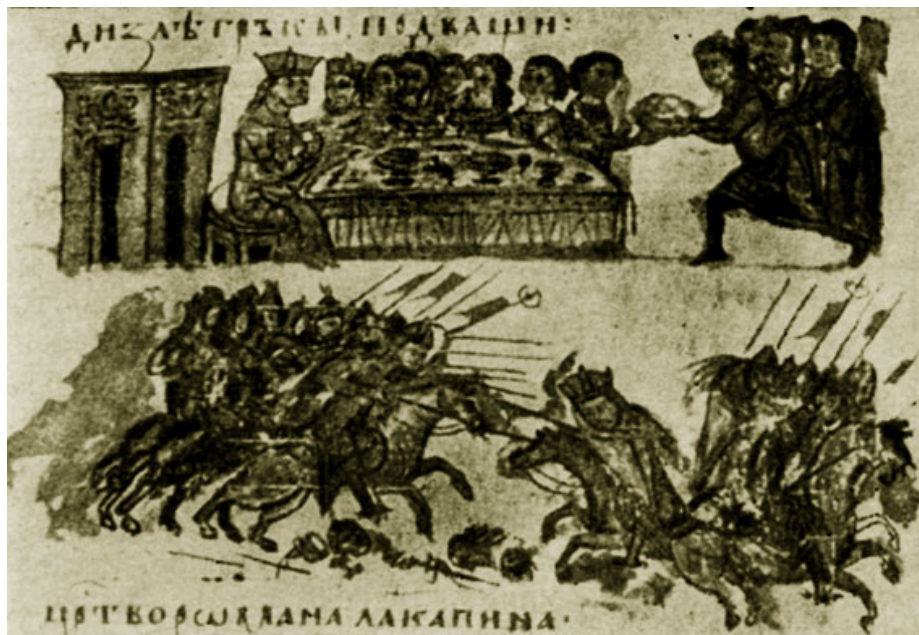
Пиршество и военная сцена. Иллюстрация из рукописи славянского перевода хроники Константина Манасси. XIV в. Ватикан.

Жители-христиане занятых арабами и турками областей оказывались (так же как и евреи) в положении униженных: они должны были носить даже внешние знаки принадлежности к гонимой религии (пояс, черный тюрбан). Церкви и монастыри арабы перестраивали в крепости: монахов и священников при этом нередко уничтожали. Терпимы к иноверцам были отнюдь не все эмиры: время от времени устраивались погромы, когда христиан вырезали целыми семьями.