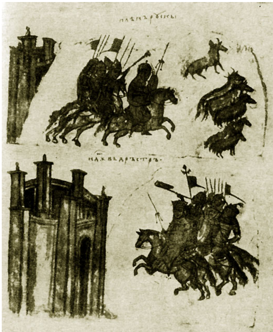
Походы Святослава на Балканы. Иллюстрация из рукописи славянского перевода хроники Константина Манасси. XIV в. Ватикан.