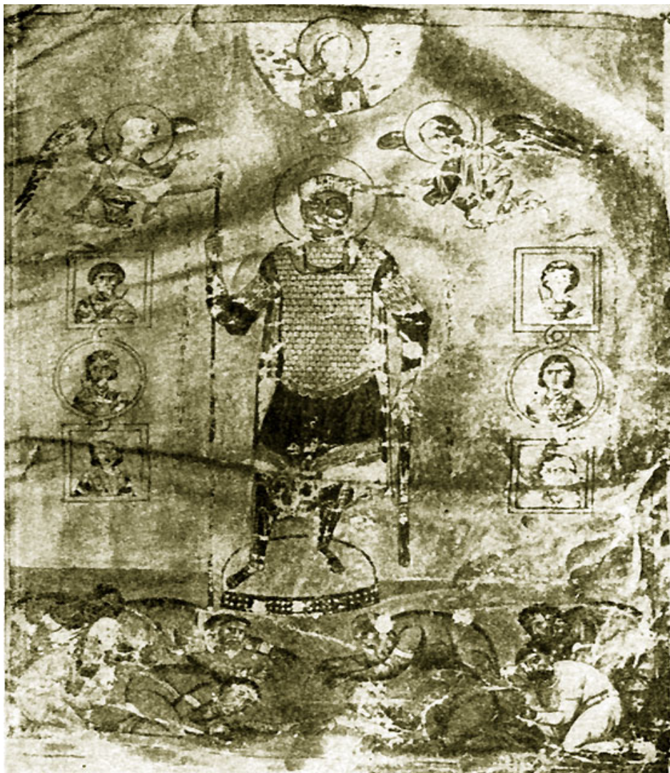
Поверженные враги у ног Василия II Болгаробойцы. Иллюстрация из 'Монология Василия II'. Начало XI в. Ватикан.