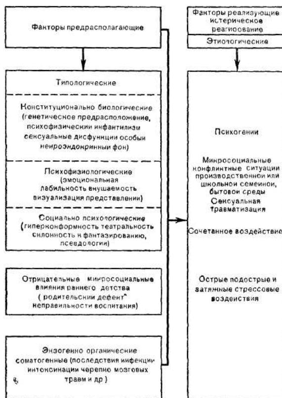
Схема 2 Нлиино патогенетические