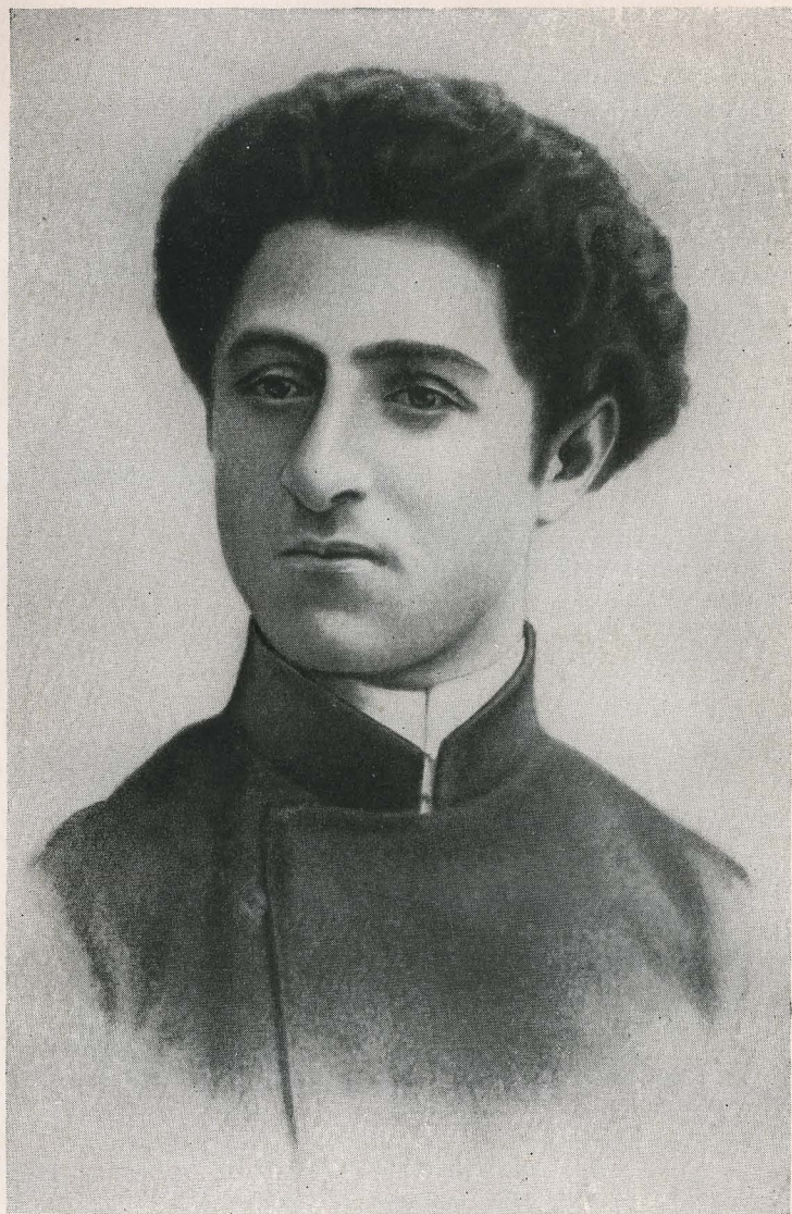
Серго Орджоникидзе (1905 г.).