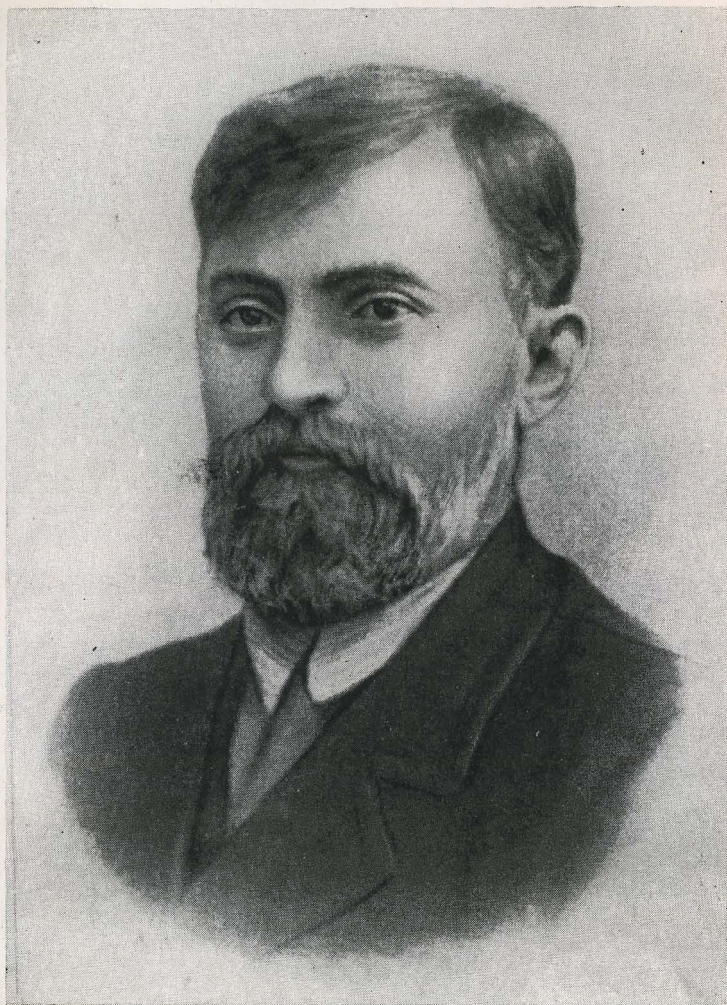
Миха Цхакая (апрель 1905 г.).