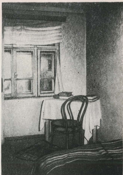
София, ул. Веслец, дом № 63, в котором жил Ной.