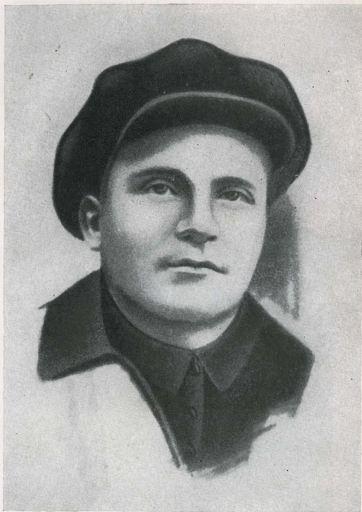
С. М. Киров. Редкий снимок периода работы в редакции газеты «Терек».