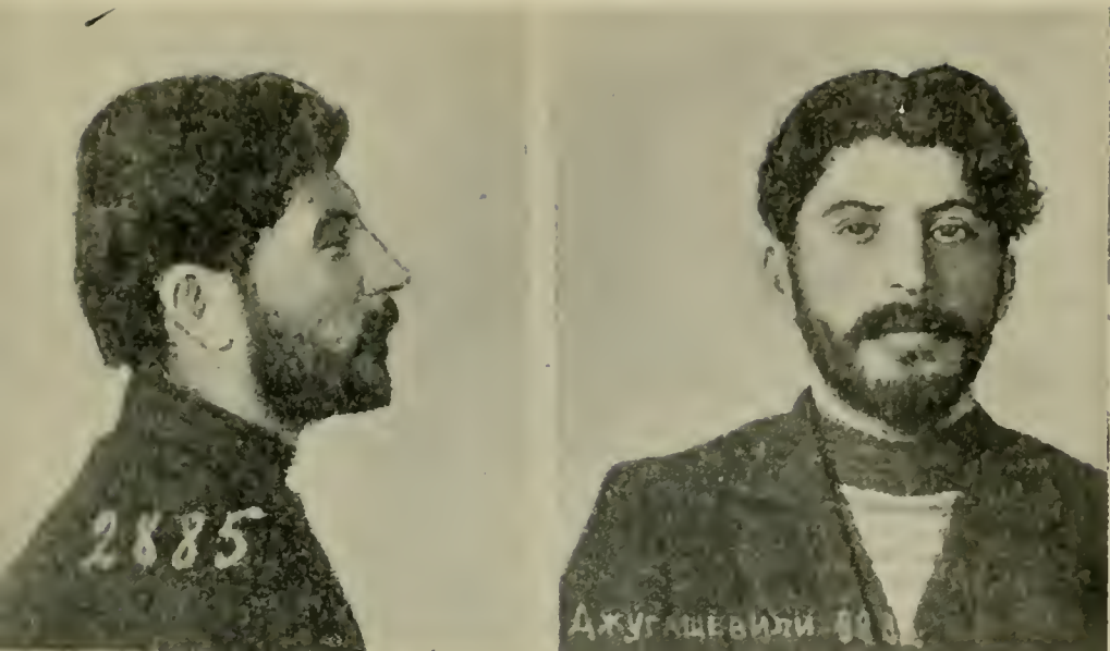
І. В. ДЖУГАШВИЛИ («СТАЛИНЪ»).