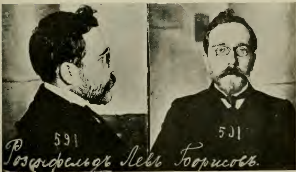
Л. Б. РОЗЕНФЕЛЬДЪ («КАМЕНЕВЪ»).