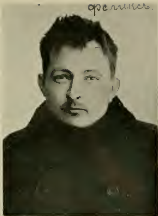
Ф. Э. ДЗЕРЖИНСКІЙ.