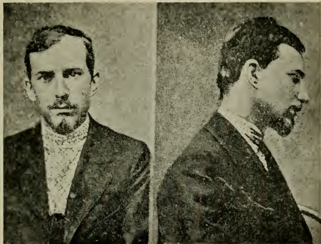
А. В. ЛУНАЧАРСКІЙ.