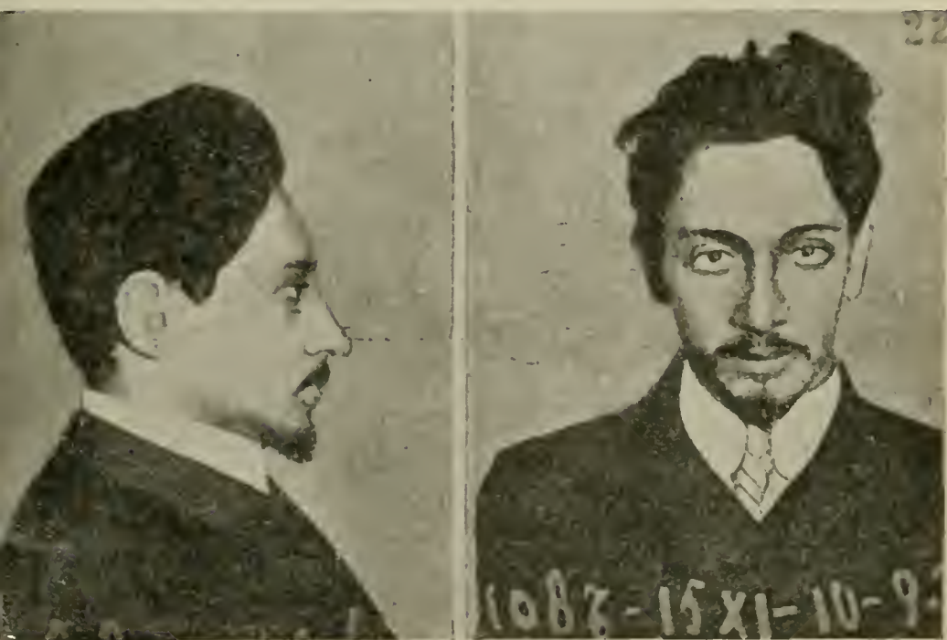
Я. М. СВЕРДЛОВЪ. (Умеръ).