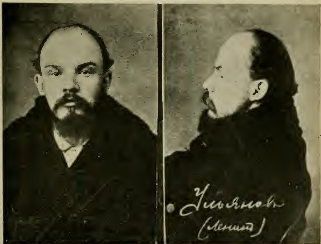
В. И. УЛЬЯНОВЪ («ЛЕНИНЪ»).

спроизведенные съ фотографій, снимавшихся въ 1896-1916 годахъ, при арестахъ ихъ русской политической полиціей.