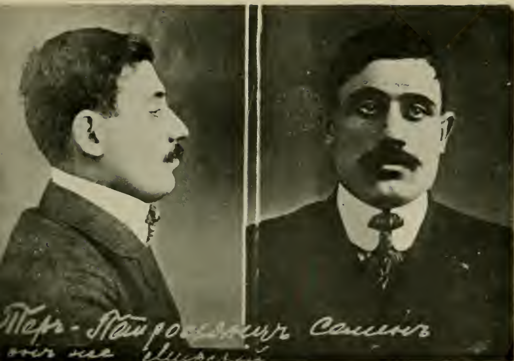
С. ТЕРЪ-ПЕТРОСЯНЦЪ («КАМО»). (У.перъ).