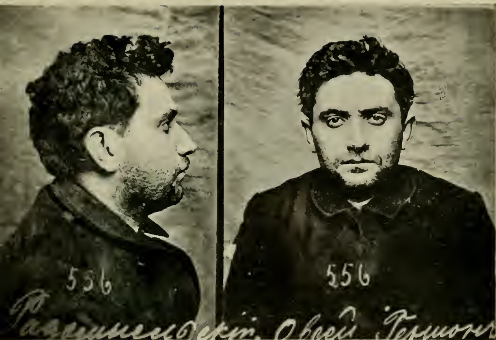
О. Г. А. РАДОМЫСЛЬСКИЙ («ЗИНОВЬЕВЪ»).