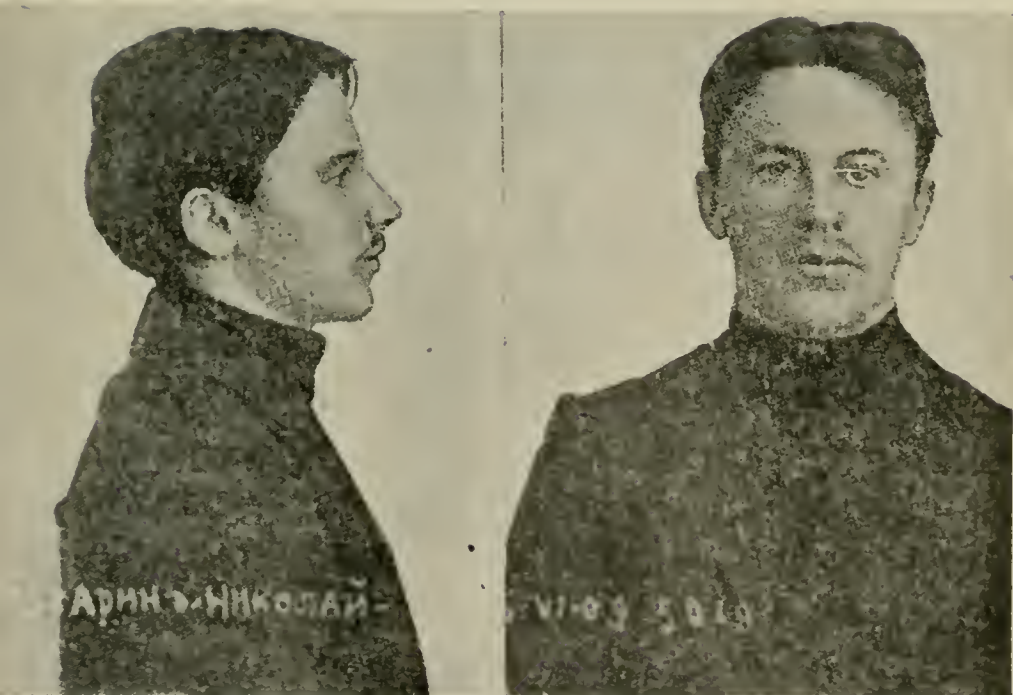
Н. И. БУХАРИНЪ