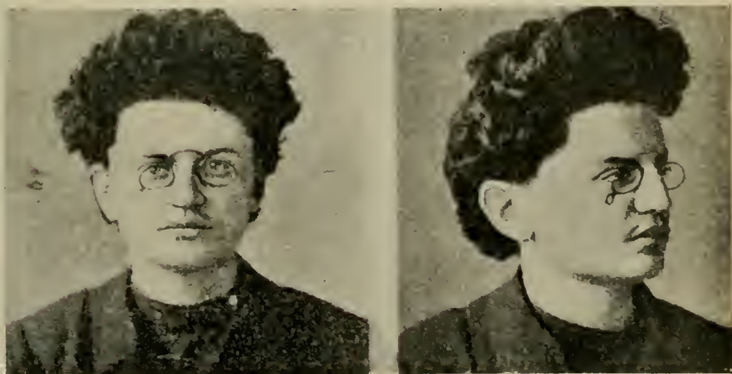
Л. Д. БРОНШТЕЙНЪ («ТРОЦКІЙ»).