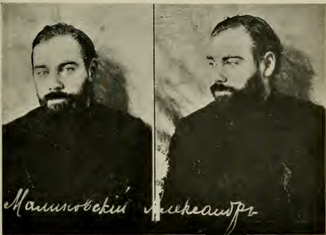
А. А. МАЛИНОВСКІЙ («БОГДАНОВЪ»).