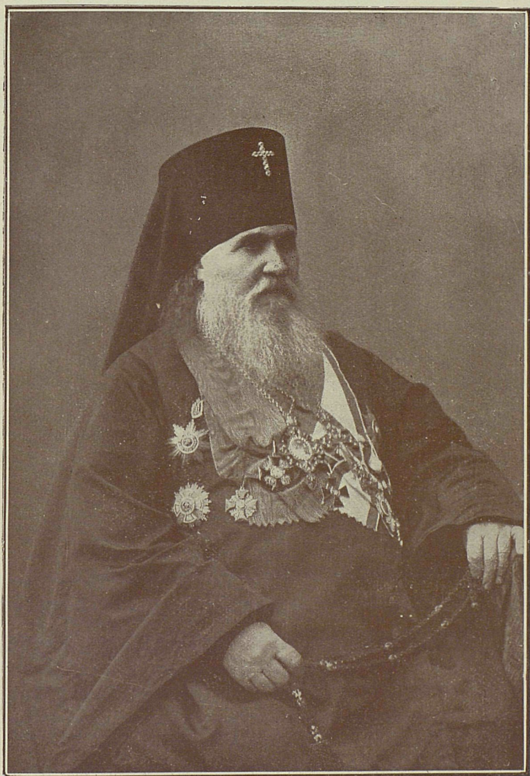
Арсевиі Архієпископа Харьковскаго и Амвросіа.