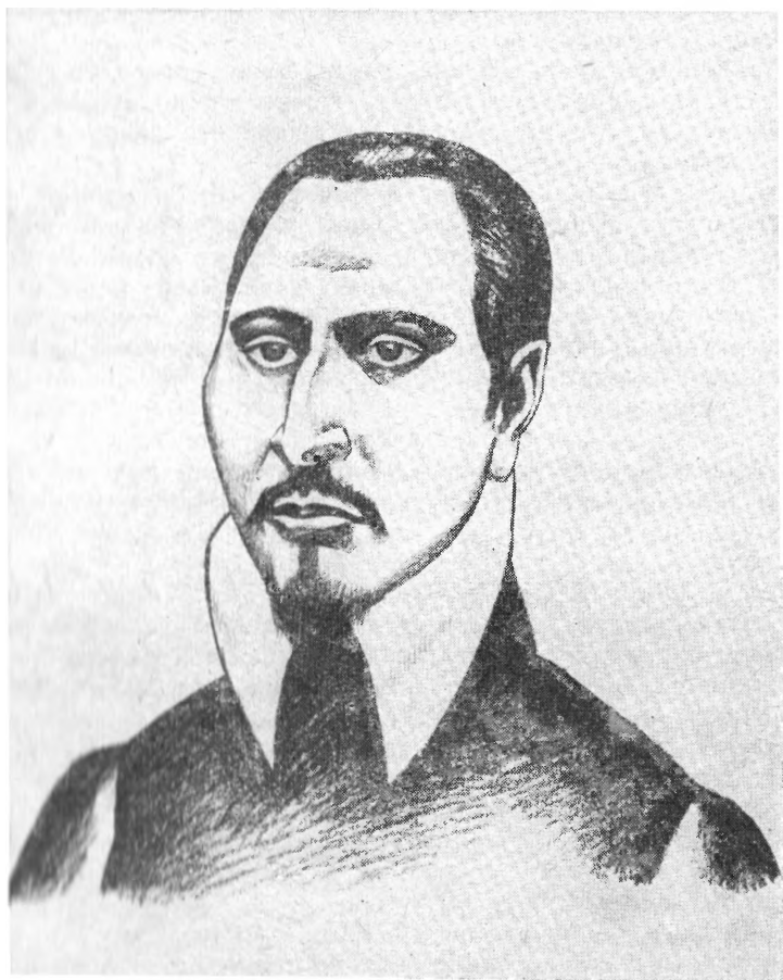
ИНИКА ГАРСИЛАСО ДЕ ЛА ВЕГА (воображаемый портрет). Рисунок автора книги

руководителю не столько недобросовестностью оппонентов, сколько отсутствием или скудностью достоверной информации о предмете спора, пробелами в наших знаниях, восполнить которые ученые не могут по не зависящим от них обстоятельствам.