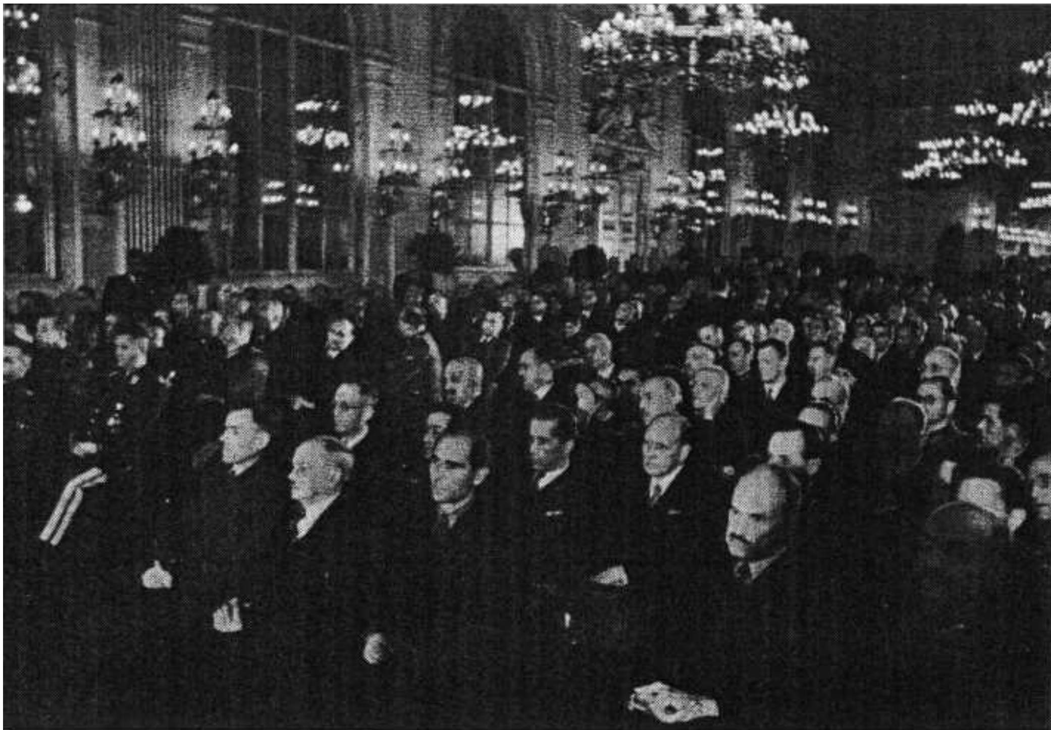
Заседание КОНРа в Праге 14 ноября 1944 года.