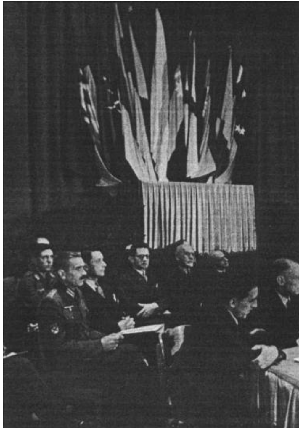
«Европа-Хаус». Эстрада, где сидят члены КОНРа.