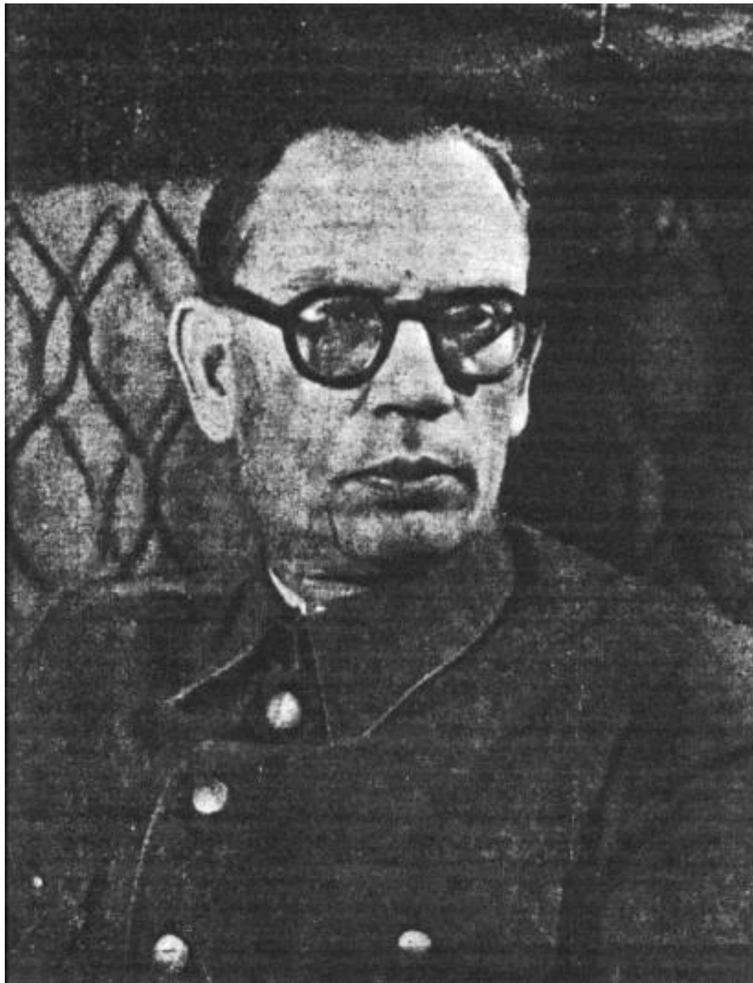
Ген. Власов в Берлине.