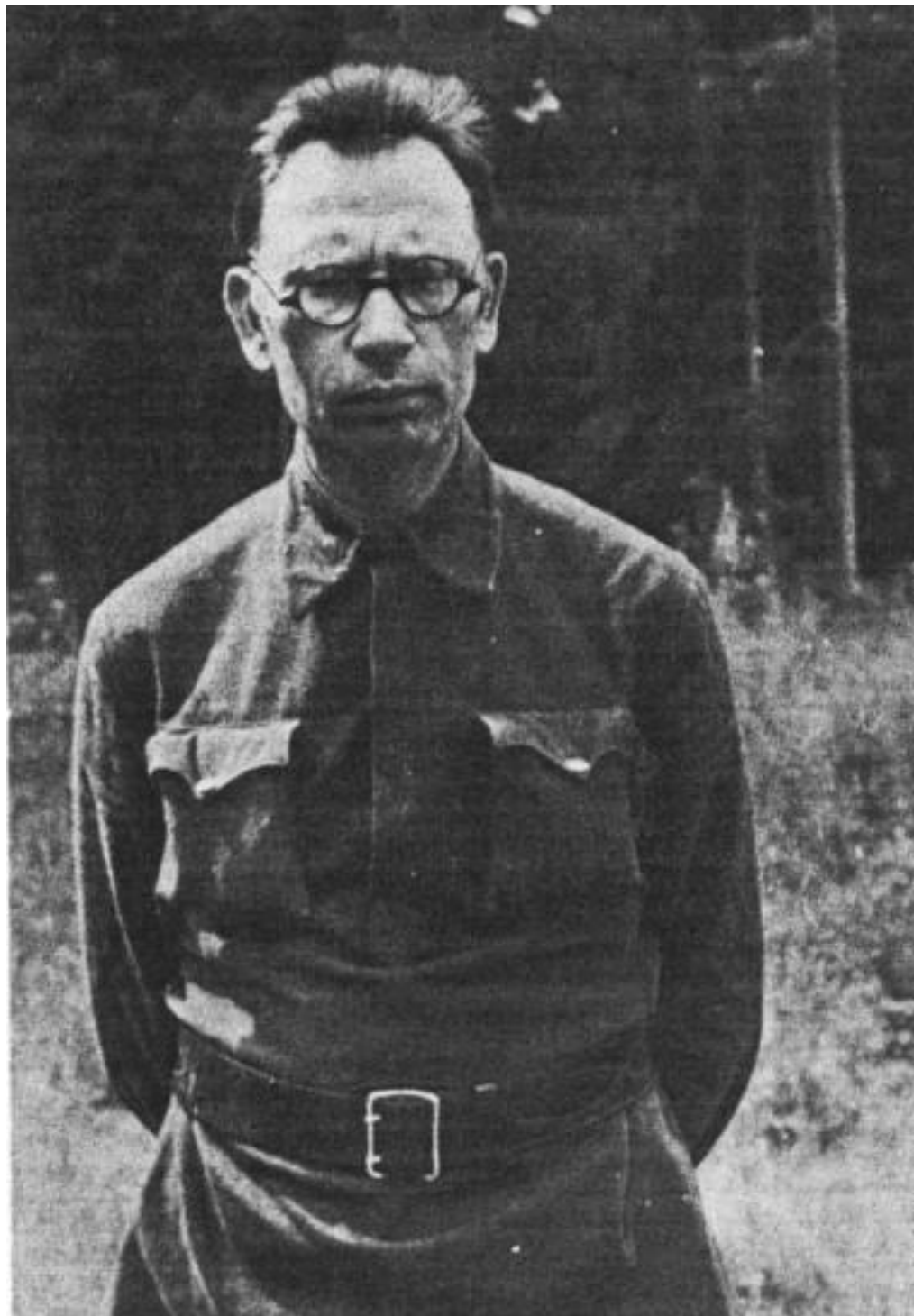
Ген. Власов в немецком лагере военнопленных.