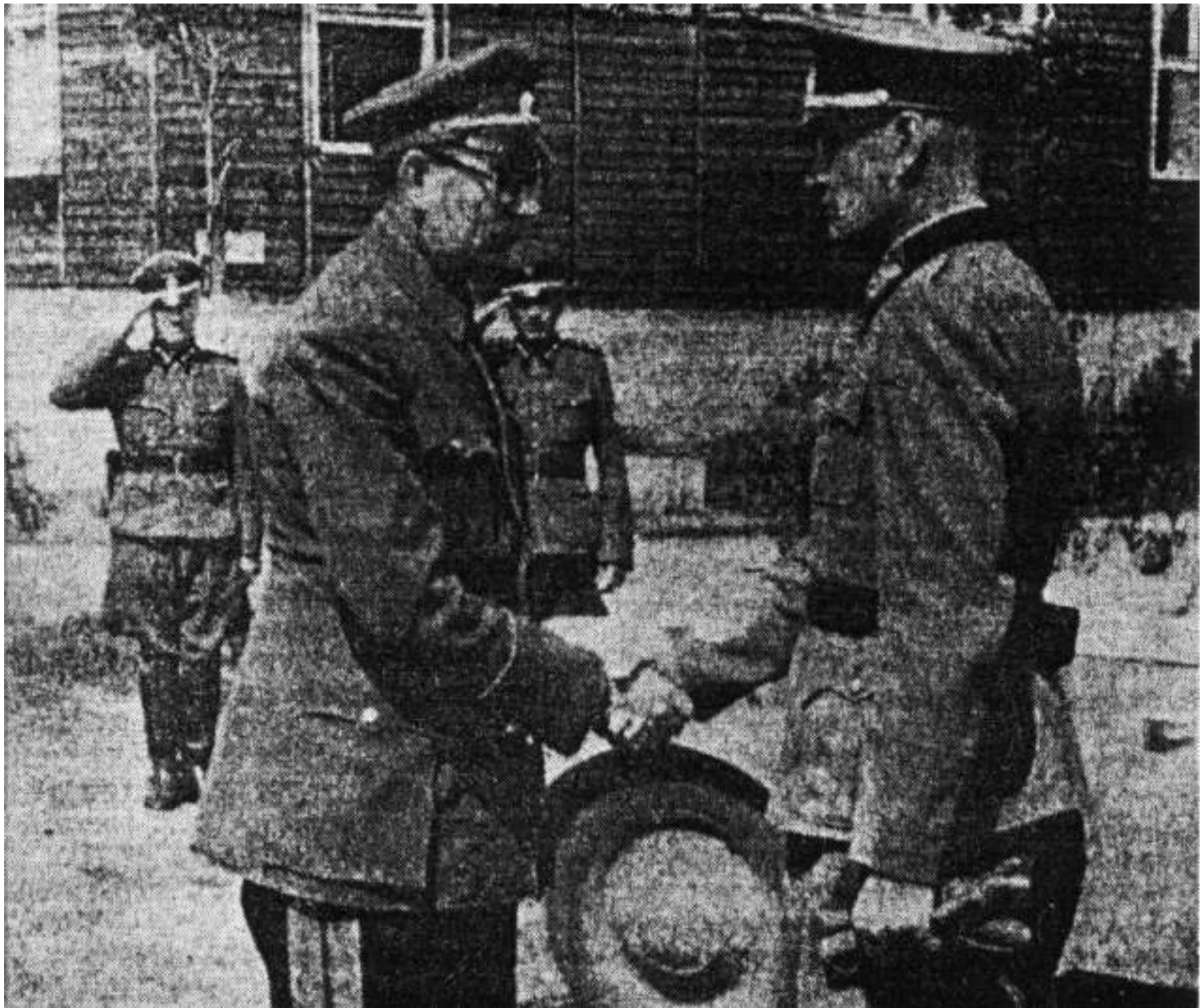
Ген. Власов принимает рапорт ген. Трухина.