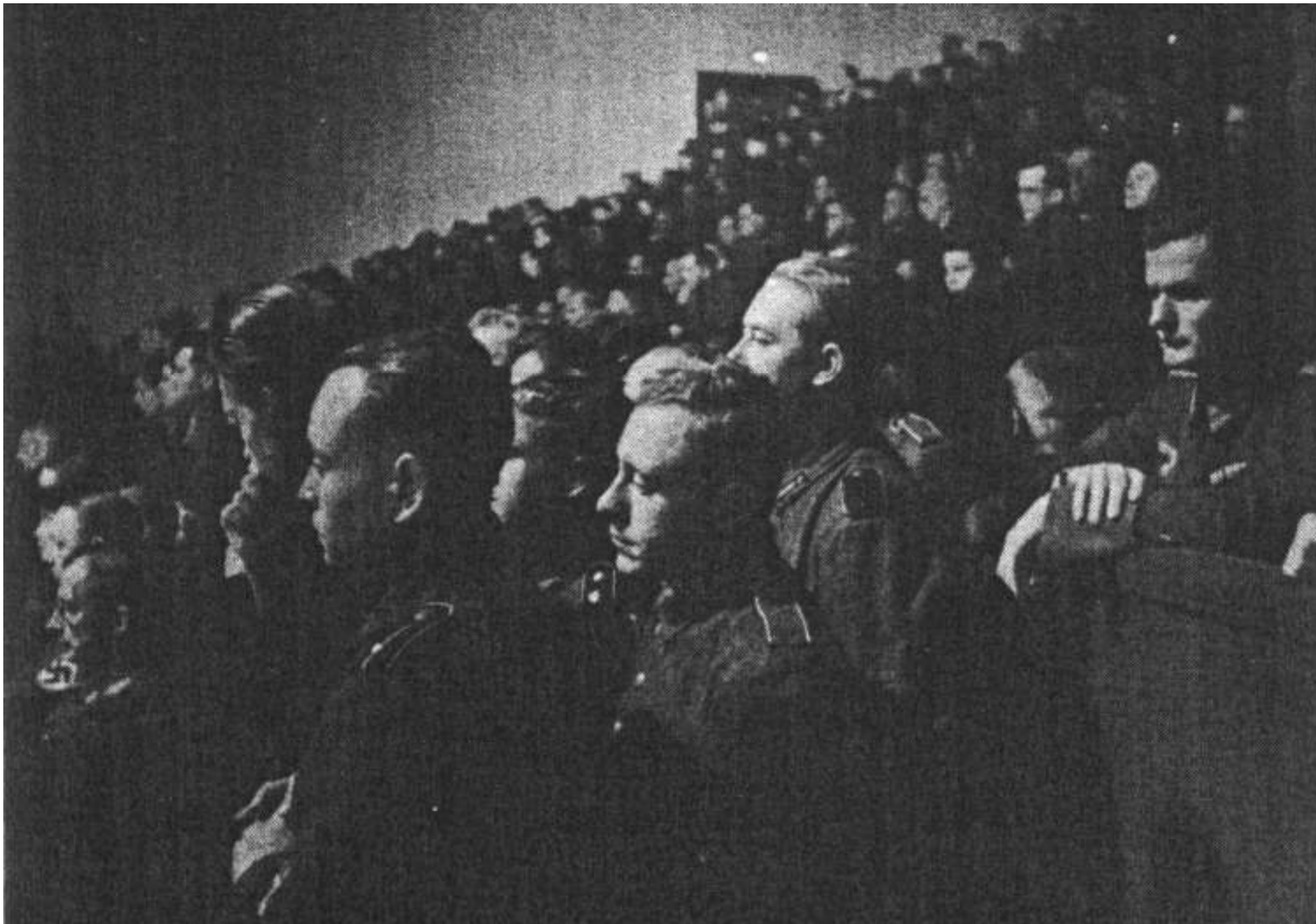
«Европа Хаус». Галерея. Среди толпы русских видны немецкие наблюдатели