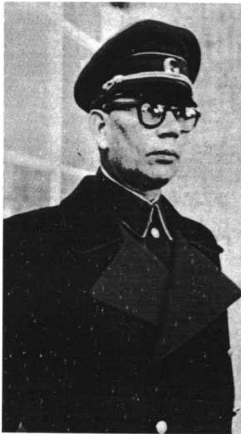
Генерал-лейтенант Андрей Андреевич Власов