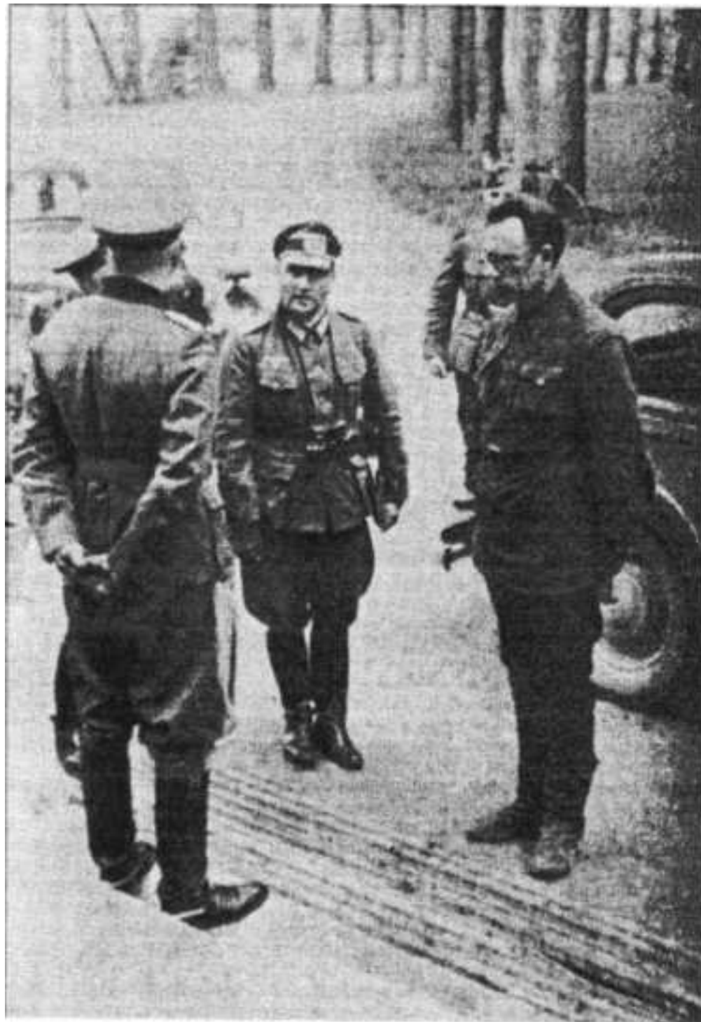
Пленный ген. Власов доставлен в штаб 18-й немецкой армии.