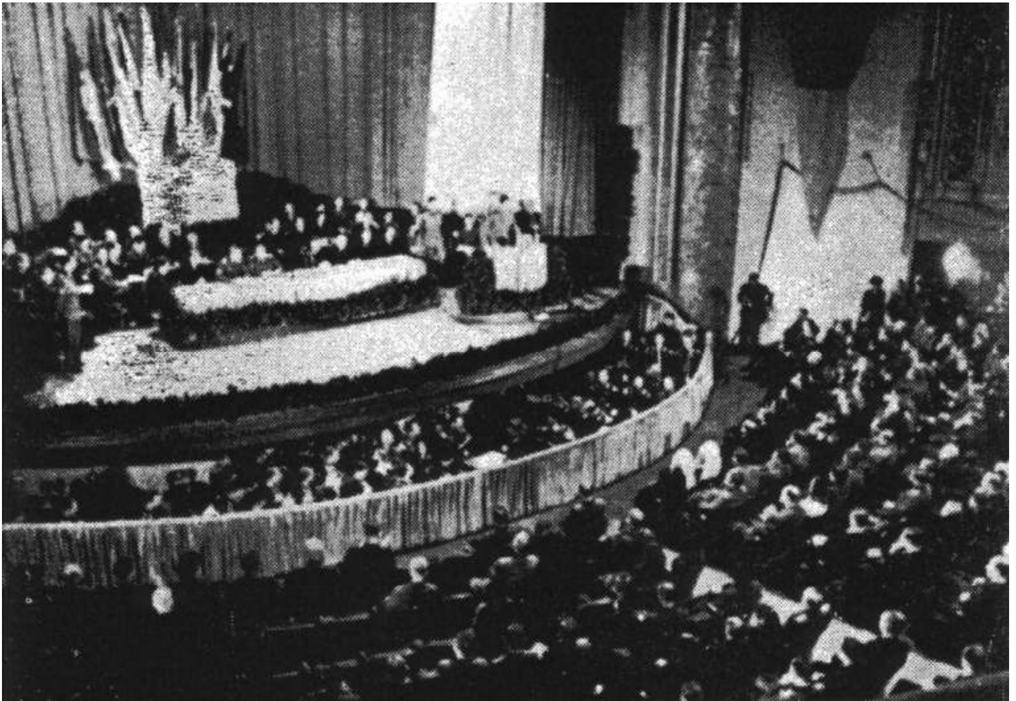
«Европа-Хаус» в Берлине во время обнародования Манифеста 18 ноября 1944 года.