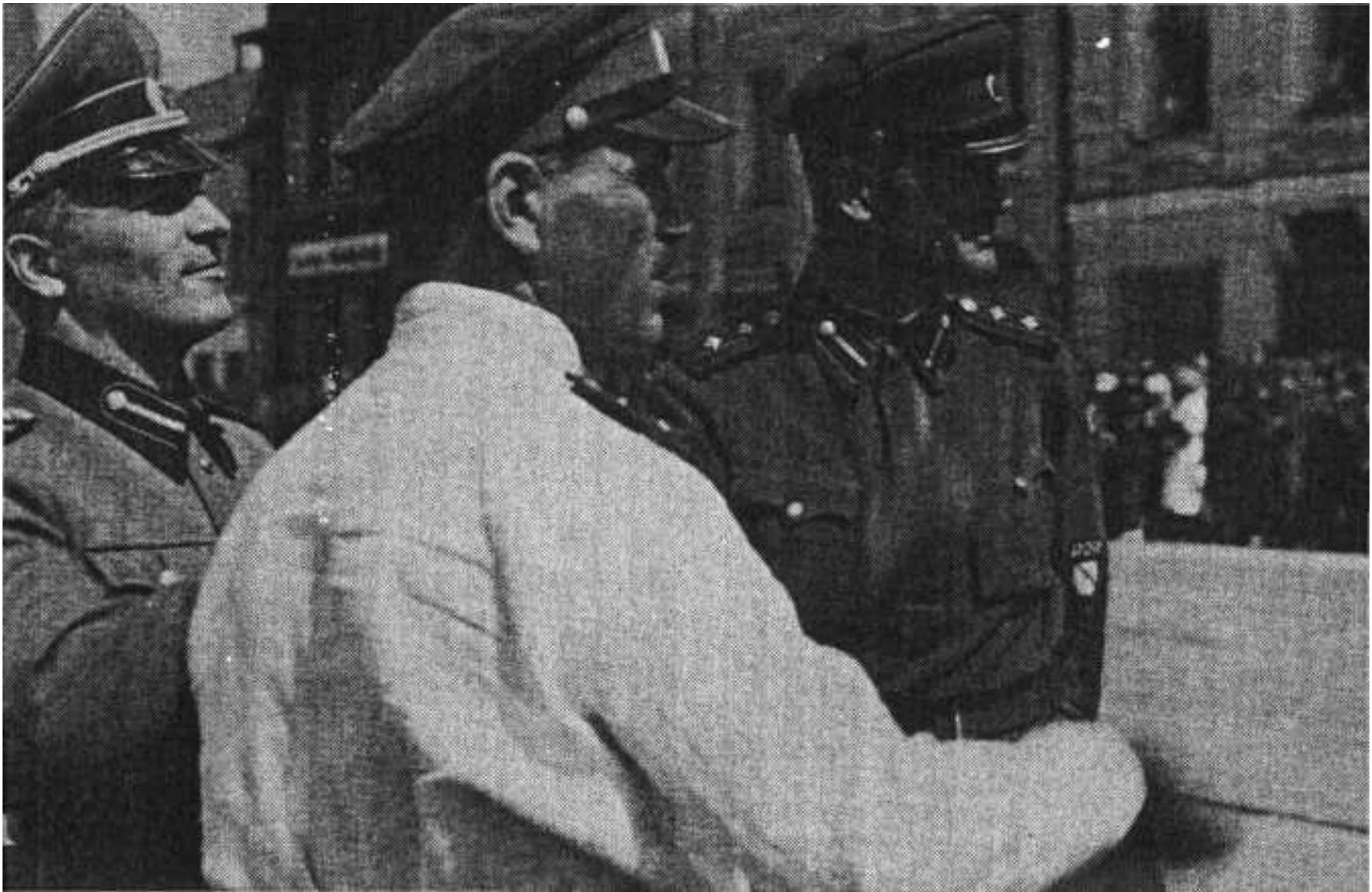
Ген. Жиленков, полков. Кромиади, полков. Боярский. Псков, 1943 год.