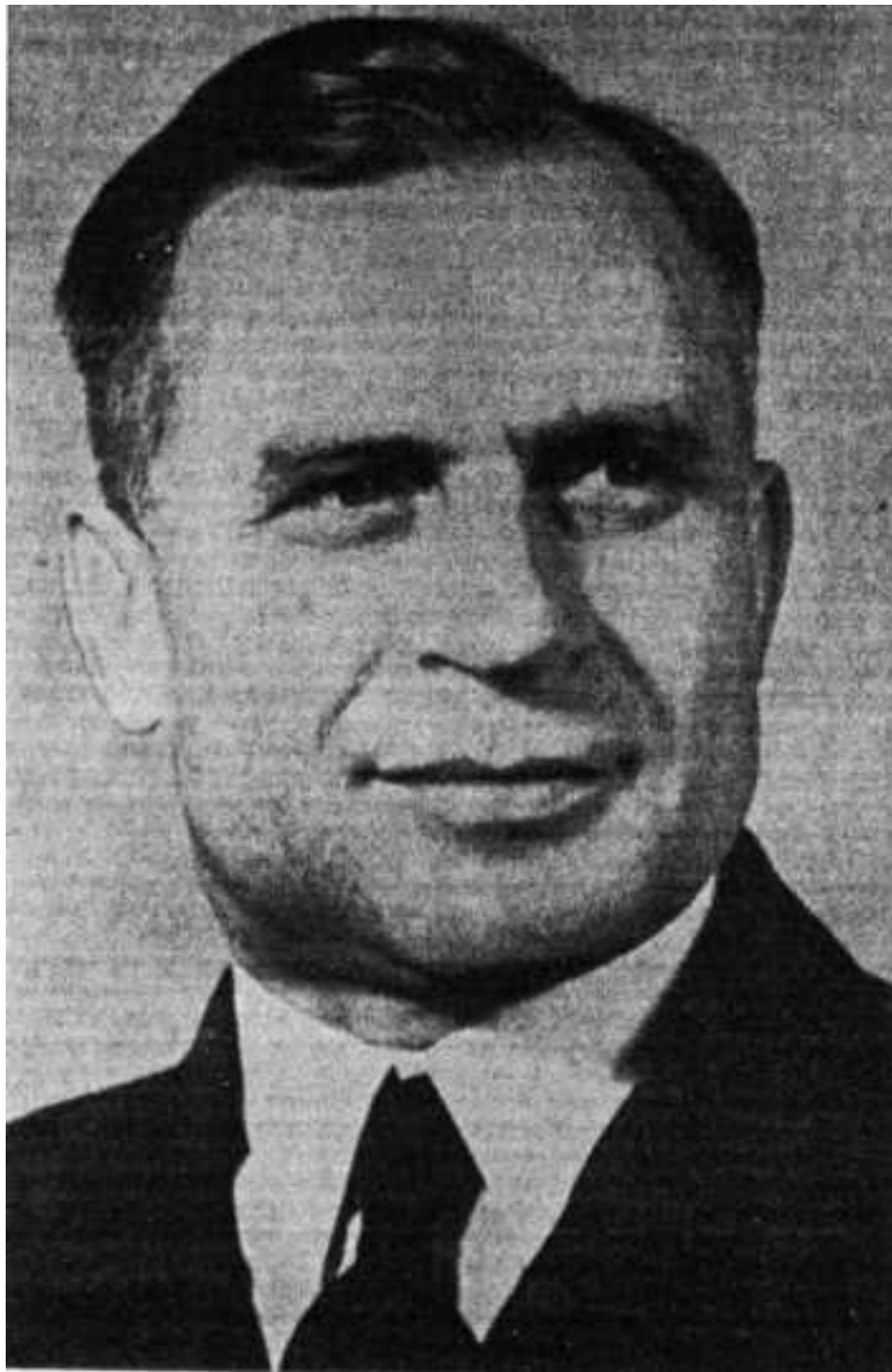
Ген. В.Ф. Малышкин.