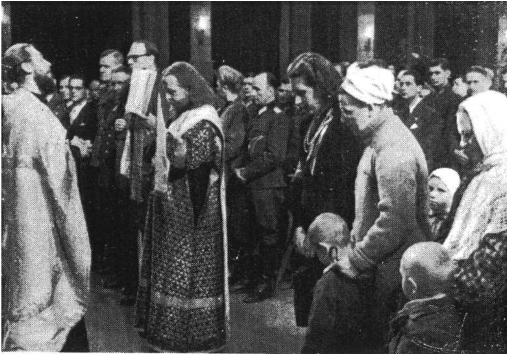
Молебен. Открытие «Народной Помощи». Рождественская елка для детей.