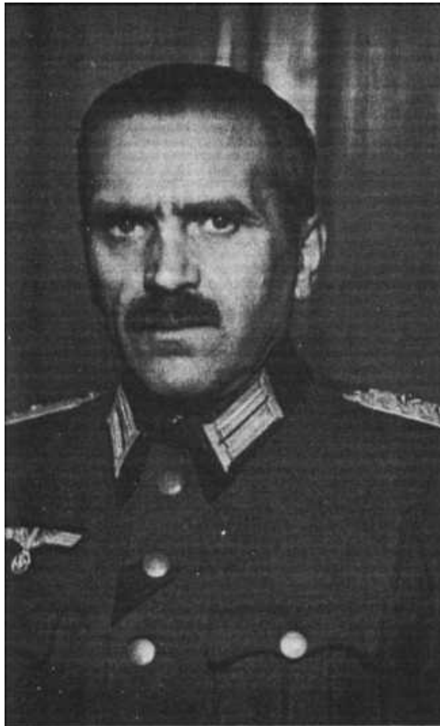
Ген. М.А. Меандров.