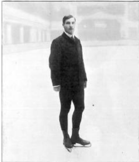
SKATING.—U. SALCHOW (SWEDEN).