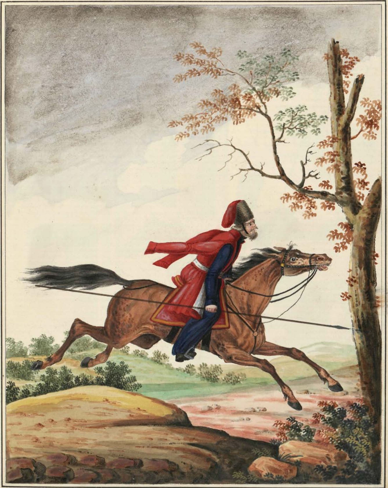
Мышевский Козакъ. 1748 го Гога.