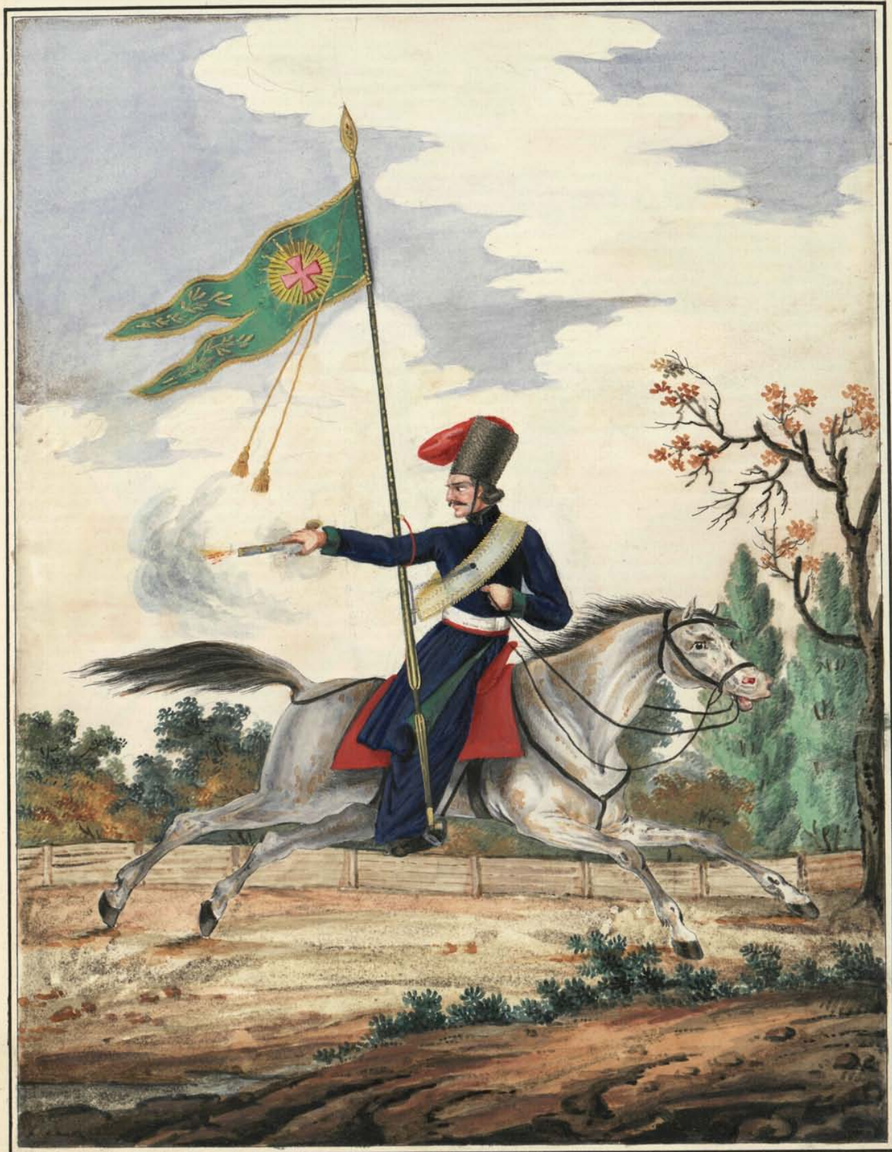
Видиенуикъ Чугуевскій Козакъ. 1772. года.