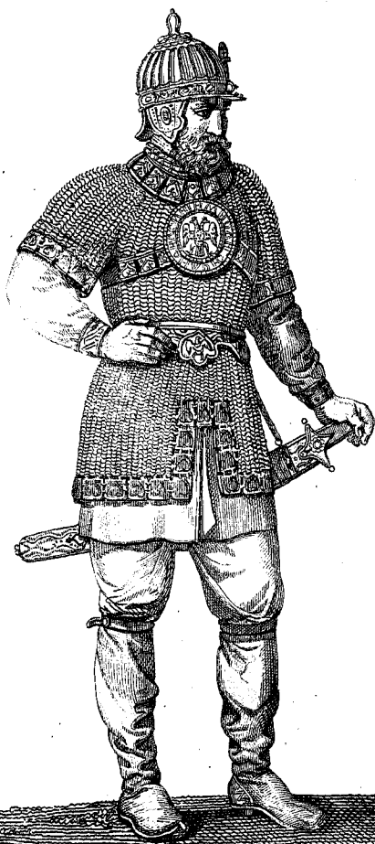
рис. К. Орлова