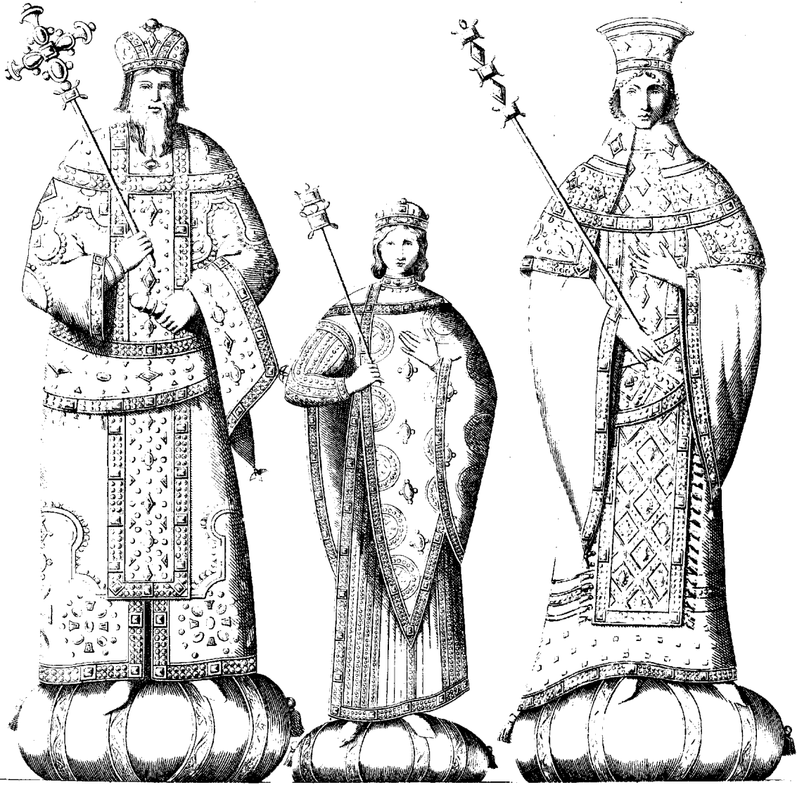
ΜΙΧΑΗΛ ΕΝ ΧΡΙΣΤΩ ΤΩ ΘΕΩ ΠΡΩΤΟΣ ΒΑΣΙΛΕΥΣ ΚΑΙ ΑΥΤΟΚΡΑΤΩΡ ΡΩΜΑΙΩΝ